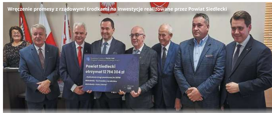
Wręczenie promesy z rządowymi środkami na inwestycje realizowane przez Powiat Siedlecki

- Ale samorządowcy alarmują, że obniżka PITu zmniejszyła ich dochody.