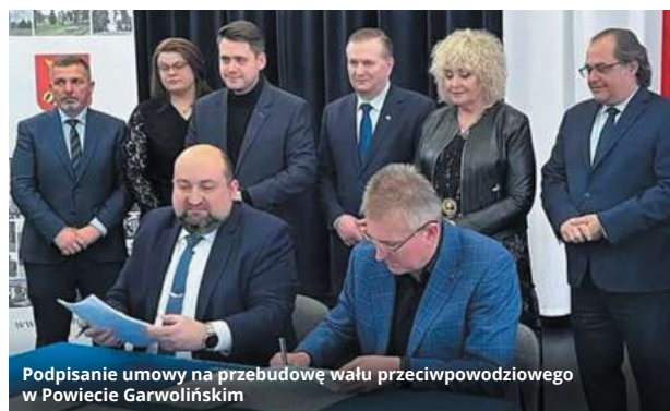
Podpisanie umowy na przebudowę wału przeciwpowodziowego w Powiecie Garwolińskim

prawo korzystać z tego co oferuje największy ośrodek naszego województwa, będący jednocześnie stolicą kraju.