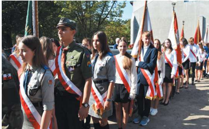
fol. Urząd Miejski w Piastowie