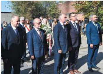
fol. Urząd Miejski w Piastowie

Mural powstał dzięki dotacji uzyskanej w ramach konkursu „MUR, ALE historia Wojska Polskiego” organizowanego przez Ministerstwo Obrony Narodowej. Wniosek w ramach konkursu zgłoszony został przez Mazowiecką Wspólnotę Samorządową przy współpracy z Miastem Piastowem.