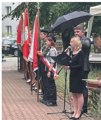
fol. Szkoła Podstawowa nr. 3 w Piastowie

czący naród polski - jak powiedział generał.