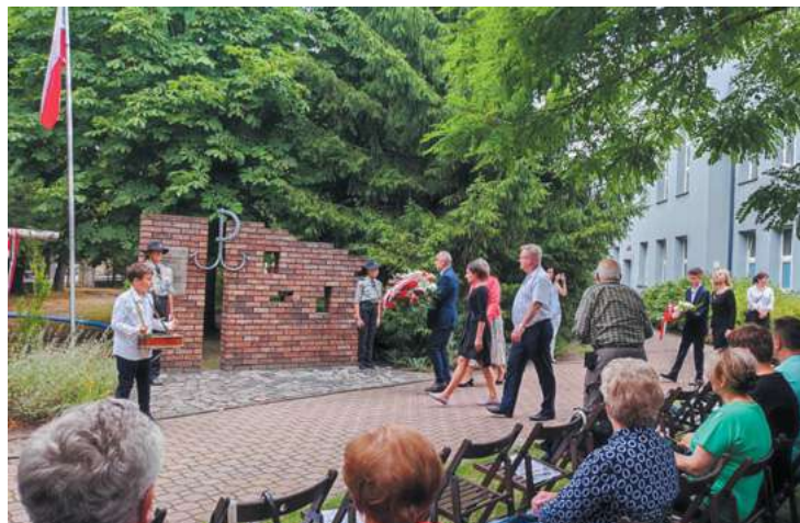
fol. Szkoła Podstawowa nr. 3 w Piastowie

Odtworzono również wojenną wypowiedź dla Radia Wolna Europa gen. Tadeusza Bora-Komorowskiego, komendanta głównego Armii Krajowej, w której tłumaczył motywy decyzji o powstaniu. Decyzja ta nie została podjęta odgórnie w 1944 r., tylko już w 1939 r. - przez wal-