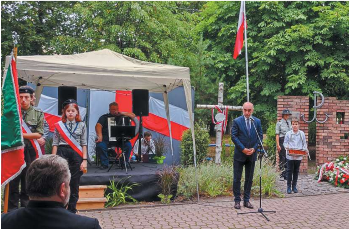
fol. Szkoła Podstawowa nr. 3 w Piastowie

je w dzisiejszym kanonie hymnu, a mianowicie: