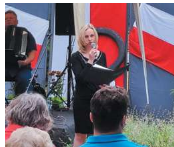
fol. Szkoła Podstawowa nr. 3 w Piastowie